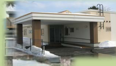
いこころ(女性定員7名) 夜間支援体制あり