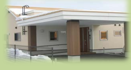
かい(男性定員6名、併設短期1名) 夜間支援体制あり