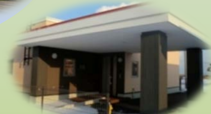
とも(男性定員7名) 夜間支援体制あり