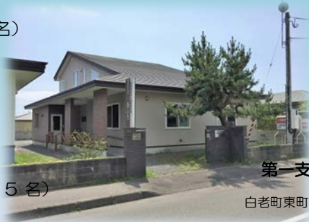
第一支援課 Tel 0144823308