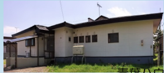
青葉ハウス(男性定員5名) 夜間支援体制あり