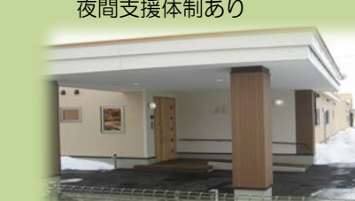
れら(男性定員7名) 夜間支援体制あり