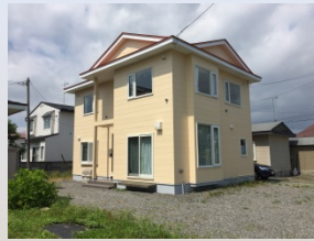
みなハウス(男性定員5名)