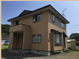
桜丘ハウス(男性定員5名)