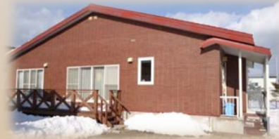
白老ハウス(女性定員4名)