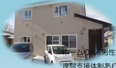
ホームりん(男性定員5名) 夜間支援体制あり