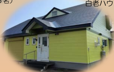
すずらんハウス(女性定員4名)