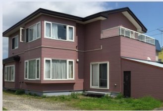
大町ハウス(男性定員5名)