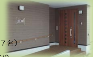
のあ(男性定員7名) 夜間支援体制あり