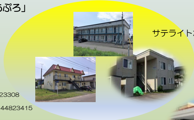
サテライトホーム(定員各1名)