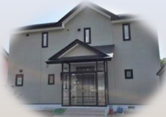
あさひハウス(男性定員5名)