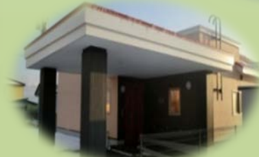
そら(男性定員7名) 夜間支援体制あり