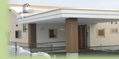
のんの(女性定員7名) 夜間支援体制あり