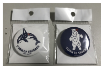
(←袋入りでバラ売りも可能)